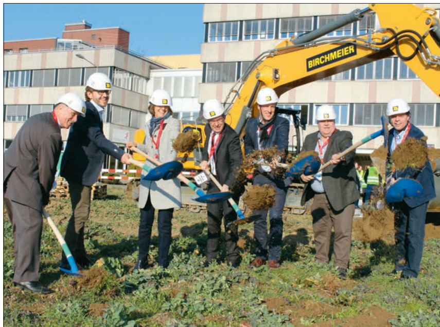
Der Spatenstich für den Neubau der Killer Ladenbau AG ist erfolgt