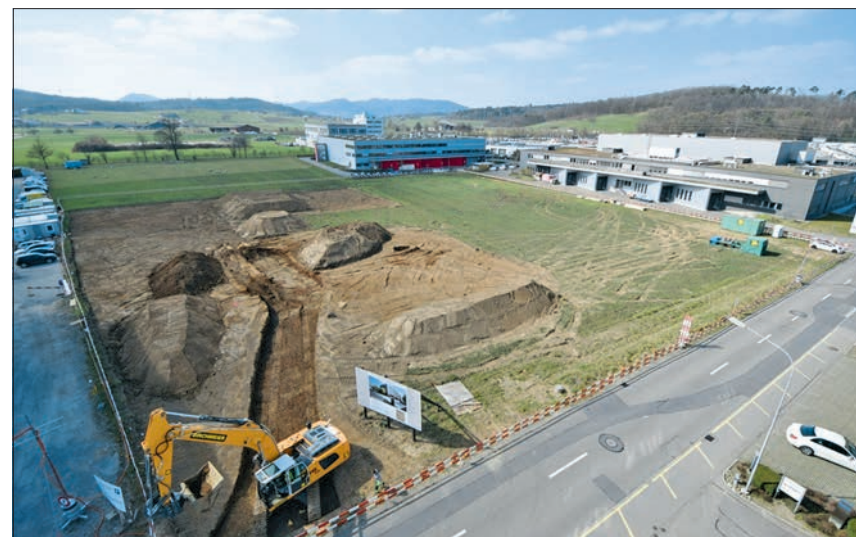
Eine Webcam hält die Fortschritte des Baus fest

Das Aargauer Familienunternehmen in dritter Generation beschäftigt rund 60 Mitarbeiter. Zu seinen Kunden gehören Firmen wie Marionnaud, Body Shop, Lindt und Visilab. Für diese entwirft und produziert die Firma Ladenkonzepte und setzt diese für den jeweiligen Kunden vor Ort um. Die Holzelemente der Einrichtung produziert die Firma selber, alle übrigen Komponenten kauft sie ein. Im 80. Jubiläumsjahr erfolgt der Spatenstich in Lupfig und besiegelt den zukünftigen Umzug von Turgi ins Eigenamt.