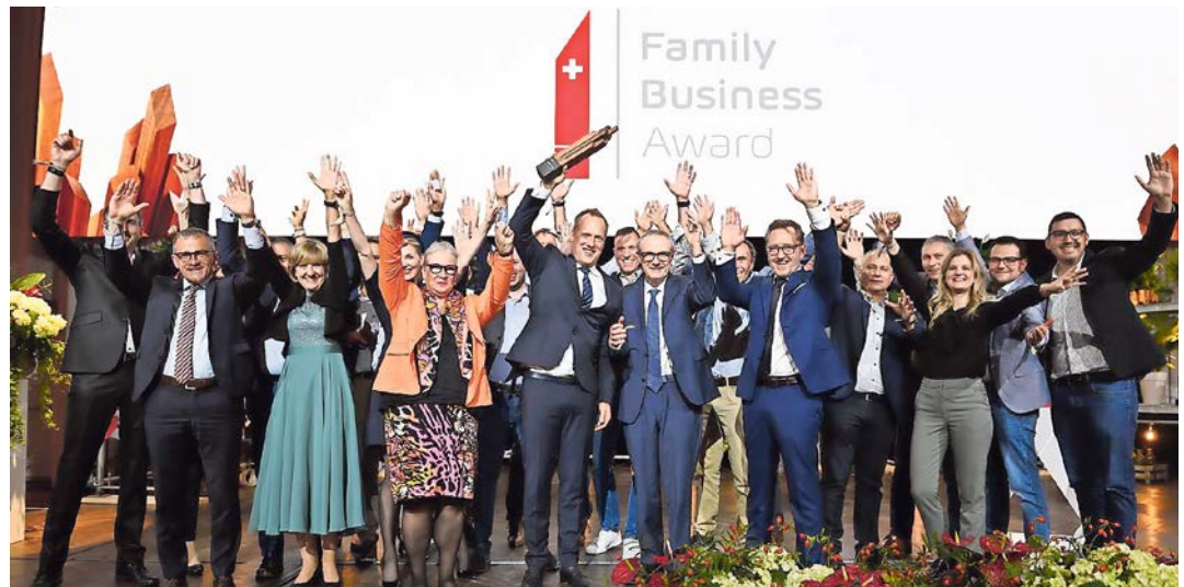
Die stolzen Gewinner des Family Business Award 2021

Soziales» im Vordergrund. Rechtzeitig auf den Jurybesuch der Finalisten konnten wir unseren «Value Cube» fertigstellen, der unsere Mission «Werte schaffen» und die Elemente unserer Vision und Strategie zeigt. Die Killer Interior will Werte schaffen durch unternehmerisches, partnerschaftliches, verantwortungsvolles sowie leistungsbereites und mitarbeiterorientiertes Handeln.